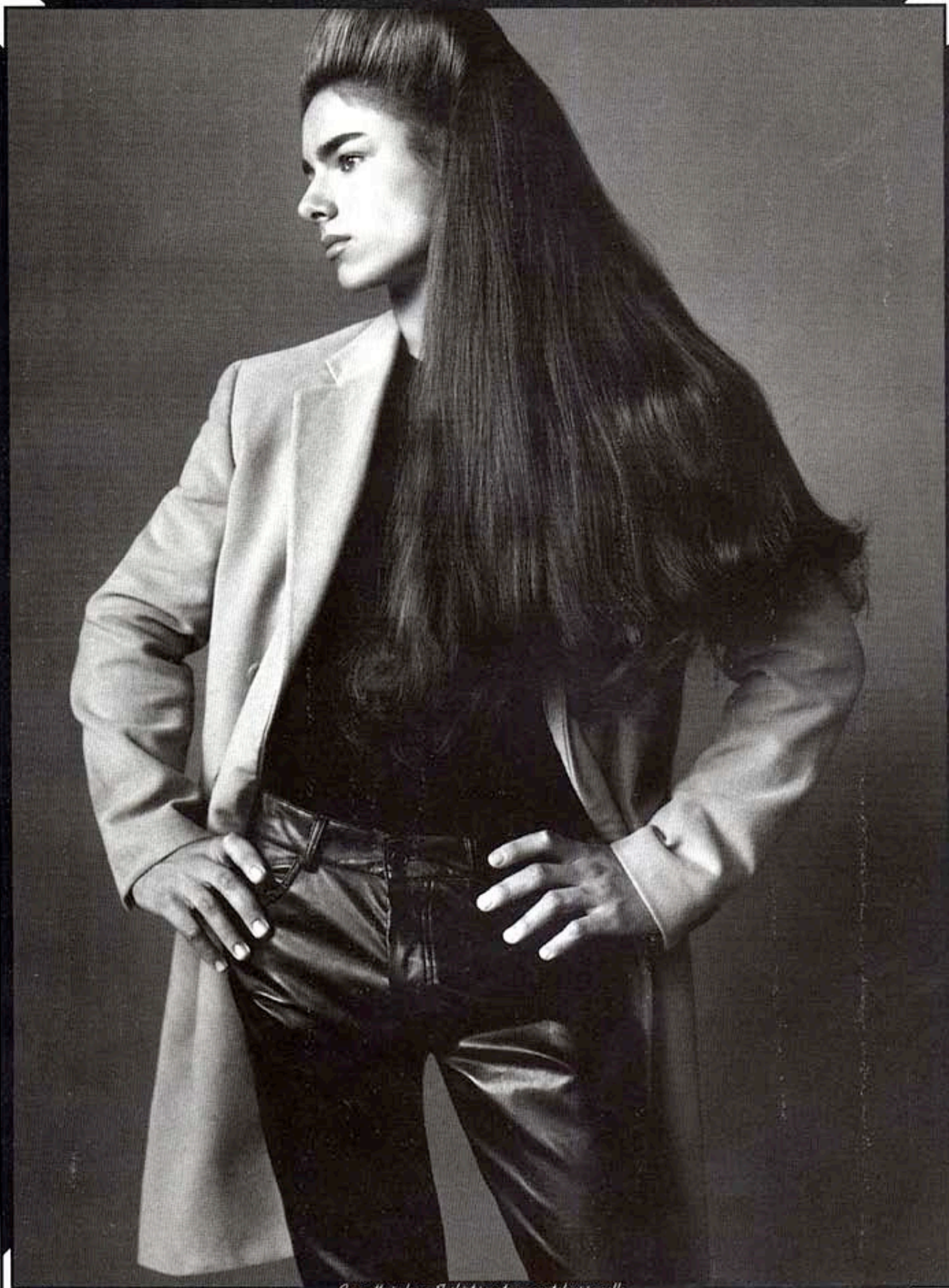
Cappotto in lana, T-shirt in cotone, pantaloni in pelle. Helmut Lang.